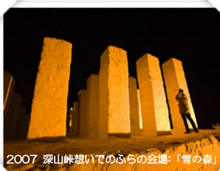
2007 深山峠想いでのふらの会場「雪の森」