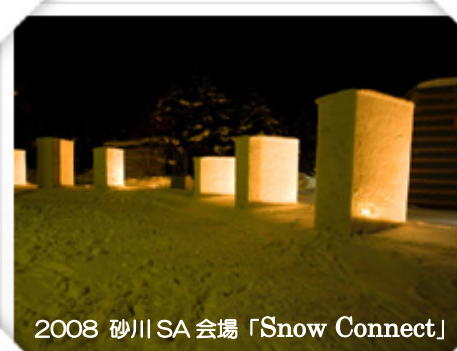
2008 砂川SA会場「Snow Connect」