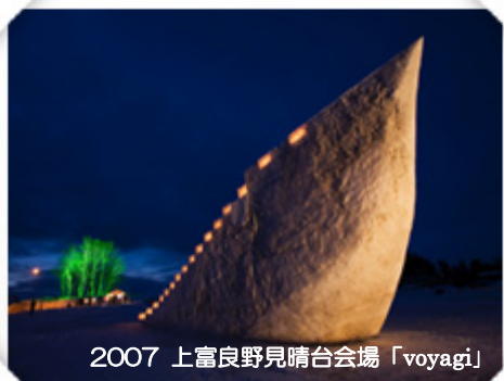
2007 上富良野見晴台会場「voyagi」